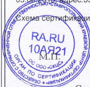
Схема сертификации: 4

акта оценки предприятия №151 от 12.02.2019 органа по сертификации ООО "СКЦС", протоколов лабораторных исследований №5171 от 09.10.2018, №14 от 24.12.2018, АИЛЦ Филиала ФБУЗ "Центр гигиены и эпидемиологии в Ставропольском крае в Предгорном районе", аттестат аккредитации №РА.РУ.21АК76 от 03.08.2016, адрес: 357350, Ставропольский край, ст. Эссентукская, ул. Эскадронная, 76